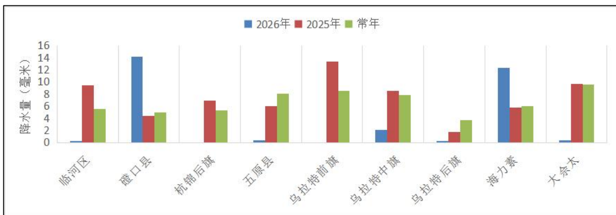
图2 巴彦淖尔市2026年、2025年及常年1月至3月降水量（单位：毫米）